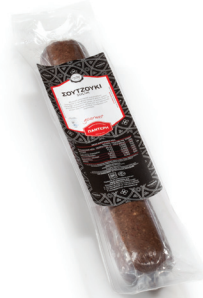
Σουτζούκι Αέρος Μπαστούνι Dry aged Beef Stick Sausage with Cumin "Sujuk" in vacuum Κωδ. 0004 / Συσκ. ~400g