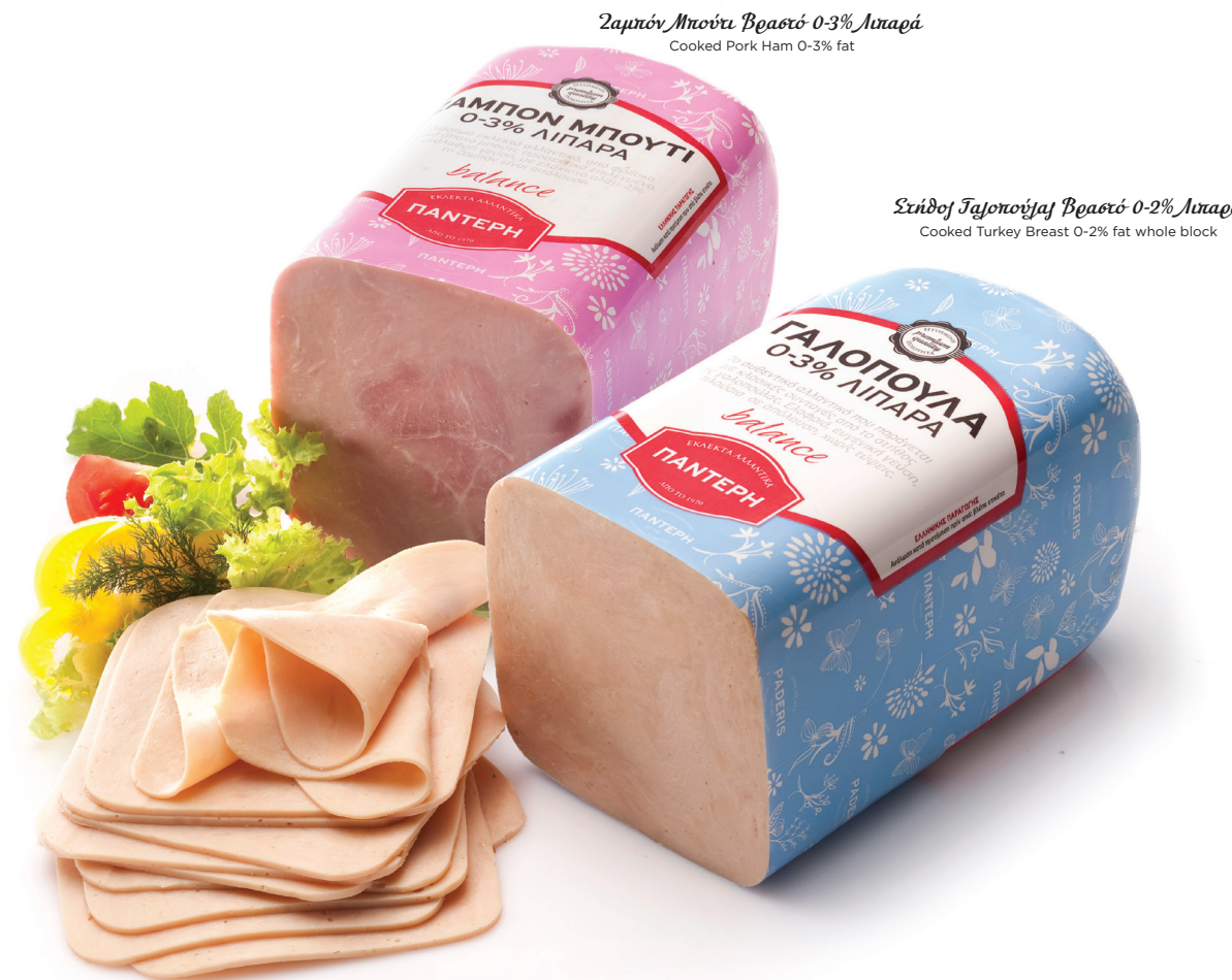
Ζαμπόν Μπούτι Βραστό 0-3% Λιπαρά Cooked Pork Ham 0-3% fat