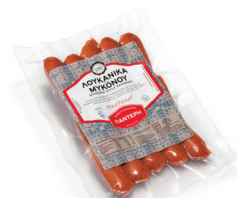
Μυκόνου τσίπου Λουκάνικα Greek Traditional Mykonos Smoked Pork Sausages with Chilli and Savory Κωδ. 0134 / Συσκ. 190g