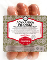
Ριγανάτα Λουκάνικα Greek Traditional Smoked Pork Sausages with Oregano 3 pcs Κωδ. 0790 / Συσκ. 3Τμχ