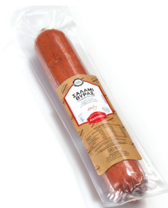
Σαλάμι Βύρας Cooked Salami