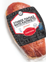
Στήθος Πάπιας Καπνιστό