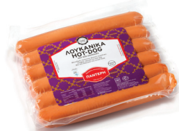
Hot Dog Λουκάνικα Hot Dog Cooked Pork Sausages Κωδ. 0176 / Συσκ. 450g