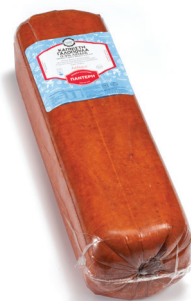
Στέιδοι Γαλοπούλας Καπνιστό 0-2% Ακόπο Smoked Turkey Breast 0-2% fat 10x10 whole block Κωδ. 0225 / Συσκ. ~4kg