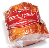
Λαιμός Χοιρινός Καπνιστός