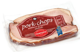
Μπριζόλα φιλ. Χοιρινή Α/Θ Καπνιστή

Smoked Pork Chops Boneless in Vacuum 2 pcs