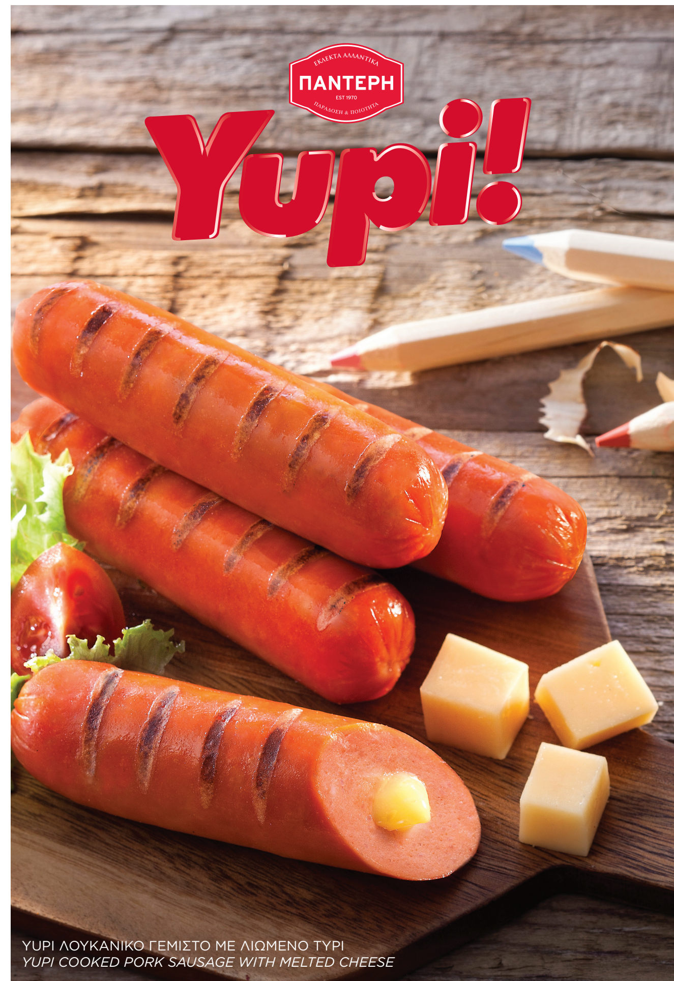
YUPI ΛΟΥΚΑΝΙΚΟ ΓΕΜΙΣΤΟ ΜΕ ΛΙΩΜΕΝΟ ΤΥΡΙ YUPI COOKED PORK SAUSAGE WITH MELTED CHEESE