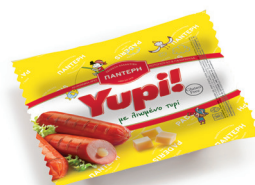
Yupi Λουκάνικο Γεμιστό με Λιωμένο Τυρί Cooked pork sausage with melted cheese Κωδ. 1011 / Συσκ. 150g