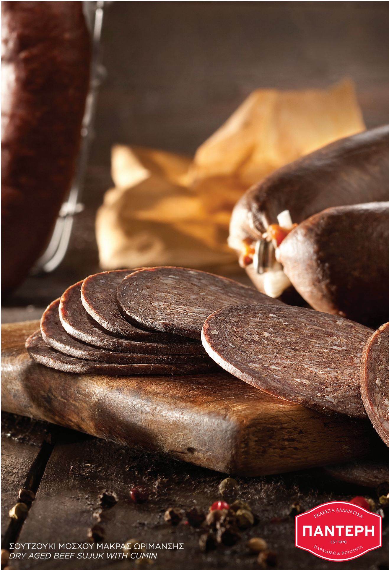
ΣΟΥΤΖΟΥΚΙ ΜΟΣΧΟΥ ΜΑΚΡΑΣ ΩΡΙΜΑΝΣΗΣ DRY AGED BEEF SUJUK WITH CUMIN