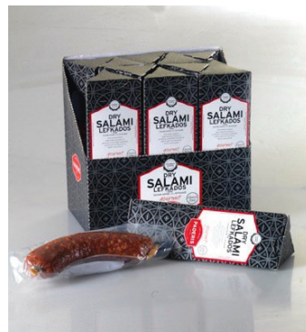
Σαλάμι Αέρος τύπου Λευκάδος Dry Salami Lefkados type Κωδ. 0439 / Συσκ. 180g