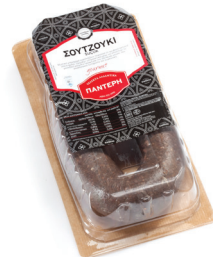
Σουτζούκι Αέρος Πέταλο Dry aged Beef U-shape Sausage with Cumin "Sujuk" in M.A.P Κωδ. 0762 / Συσκ. 420g