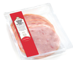
Golden Ζαμπόν Καπνιστό 0-3% Sliced Smoked Pork Ham 0-3% fat Κωδ. 0228 / Συσκ. 250g