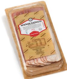
Μπεϊκόν Καπνιστό Sliced Smoked Bacon