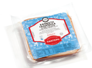
Στέιδοι Γαλοπούλας Καπνιστό 0-2% Sliced Smoked Turkey Breast 0-2% fat 10x10 Κωδ. 0190 / Συσκ. 200g