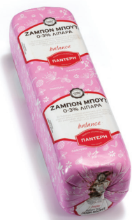
Ζαμπόν Μπούτι Βραστό 0-3% Cooked Pork Ham 0-3% fat 10x10 whole block Κωδ. 0016 / Συσκ. ~4kg