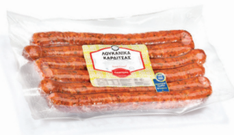
Καρδίτσας τσίπου Λουκάνικα Greek Traditional Karditsas Smoked Pork Sausages with Leek Κωδ. 0006 / Συσκ. 1,5kg