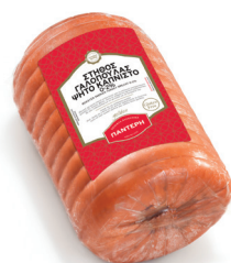
Golden Στήθος Γαλοπούλας Καπνιστό 0-2% Smoked Turkey Breast 0-2% fat whole block Κωδ. 0224 / Συσκ. ~4kg