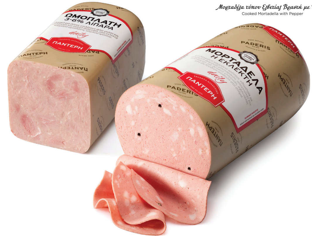
Μορταδέλα τύπου Ελβετίας Βραστή με Πιπέρι Cooked Mortadella with Pepper