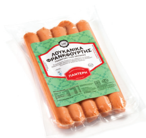
ΦρανκφούρτηL vien Λουκάνικα Cooked Pork Frankfurter sausages Κωδ. 0177 / Συσκ. 450g