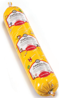
Παριζάκι Βραστό Cooked Parizer